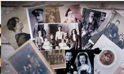
IMMERSION DANS L'HISTOIRE DE L'ACADIE